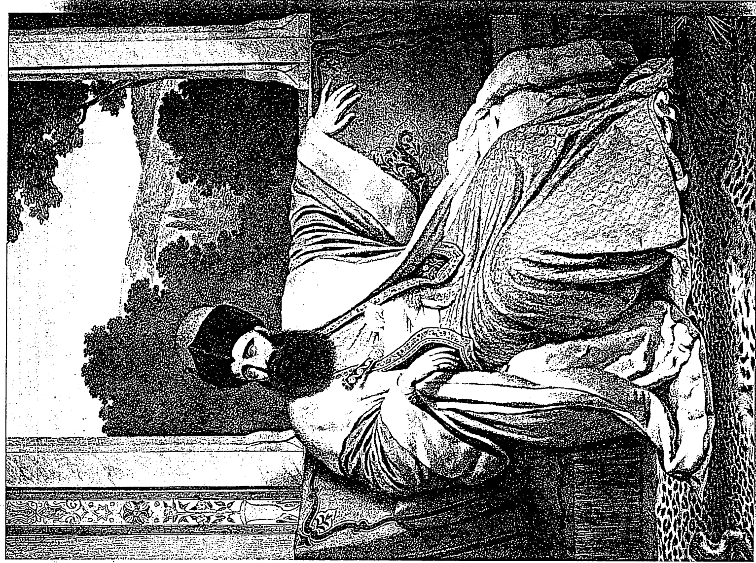
Ο Μιχαήλ Σούτινος, Πρίγκιπ της Μολδαβίας, εικονιζόμενος, ως πρότυπο Έλληνος ηγεμόνος της Ανατολής.

Άρχικα ή Άγγλια εκέφεθη νά εκμεταλλεσθί την ήττα της Τουρκίας και την επέκτασι της Ρωσικής επίρροης στον Καύκασο, με τό να εεσφαλισθί όι ταιών και άπέναντι από τον Κόλοπο της Άλεξανδρείας άντι και την Κύπρου (στην είσοδό των Στενάων και άπέναντι από τον στούκος), ίως δε και αύτην την Άλεξανδρείτα. Αυτό θα ήταν άνταποδοτική κατοχή για άποκρουσθί ή ανατριπεία (λόγω της Ρωσικής νίκης) ισσοροπία δύναμειών στη Μεσόγειο και την Δυτική Ασία όλόκληρο. Τό σχέδιο συνεπίστα συμμετοχή στην διαδίκασιο διαλύσεως της Οθωμανικής Αυτοκρατορίας, και προκάλεσε την παράτησι του Άγγλου Υπουργού Εξωτερικών Λόρδου Derby. Ο νέος Υπουργός Λόρδος Salisbury (υπό Πρωθυπουργόν τον Disraeli) μετέτρεψε την μορφή της ιδέας χωρίς να αλλάξή τό ουσιαστικό περιεχόμενον της. Σέ γράμμα του (2.5.1978) προς τον Άγγλο Πρέσβη στην Κωνσταντινούπολι έξηγγύσε: « Η άπλή παρουσία των Ρώσων στο Kars θα κινή την Πελοπόν, Μεσοποταμία και Συρία, να κοιτούν προς τον Βορρά. Τότε θα συσταθί σέ αύτες ένα Ρωσικό Κόμμα - και συνενάς άταξία - οι δε ράβυμες Διοικητικές δυνάμεις της Υψηλής Πύλης θα καταπονησθί, τό και χάος θα ακολουθήσθι, τό όποιο θα εκμεταλλεσθών με τον-